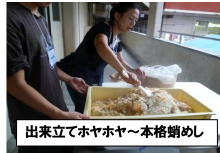
出来立てホヤホヤ～本格蛸めし