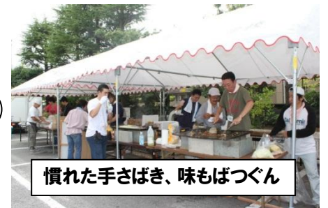
慣れた手さばき、味もばつぐん