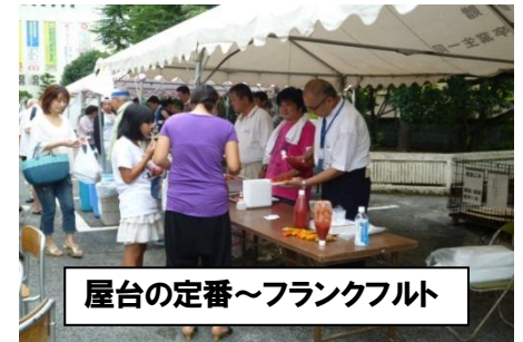
屋台の定番～フランクフルト